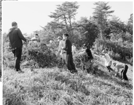
斜面の刈られた草を集めて運ぶ様子