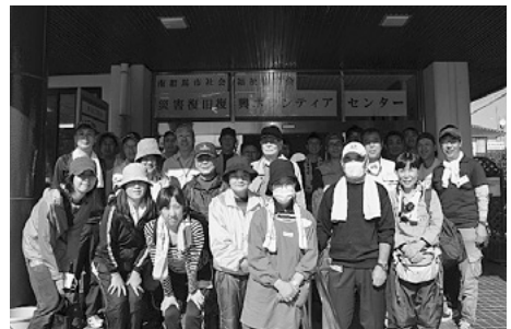
活動後の集合写真