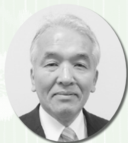
社会福祉法人 朝霞市社会福祉協議会