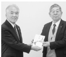
朝霞市民チャリティーゴルフ大会実行委員会