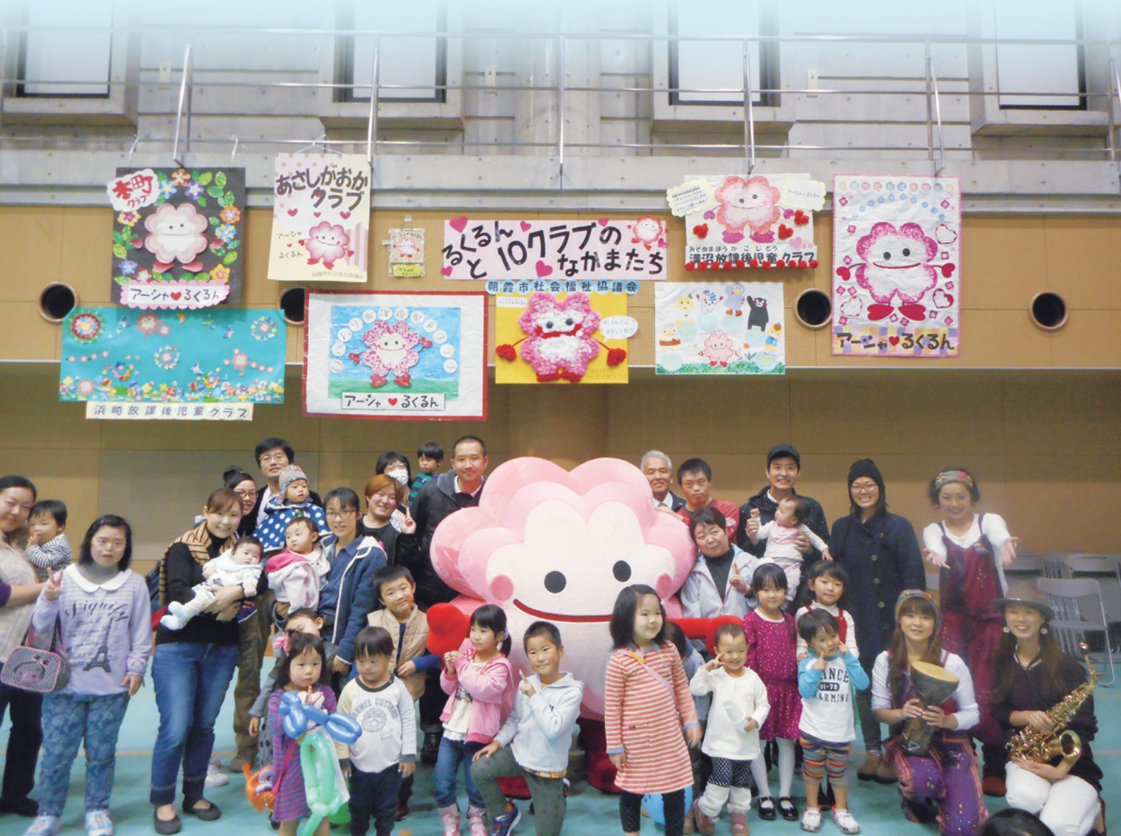
第9回はあとびあふれあい祭りでの1枚 (うたらずむ：リトミック)