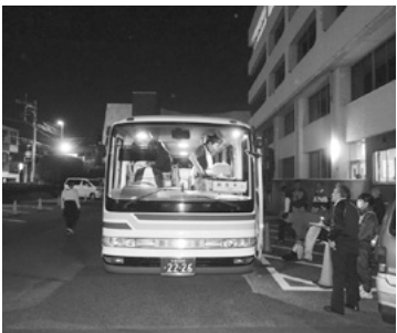
朝霞市役所から南相馬へ