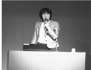
山本先生による講演の様子

社会福祉協議会は地域福祉の推進のため、今後も市民のみなさまと一緒に活動していきたいと考えております。