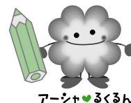
アーシャくるりん

教育支援資金は、低所得世帯の学生の就学を支援する福祉の貸付制度です。学校教育法に定められた高等学校、大学などへの進学や通学に必要な経費を貸し付け、卒業後、学生本人が返済するというものです。貸付の相談時から償還完了に至るまでの間、「社会福祉協議会」と「民生委員」がその支援にかかわります。まずはお電話でご相談ください。